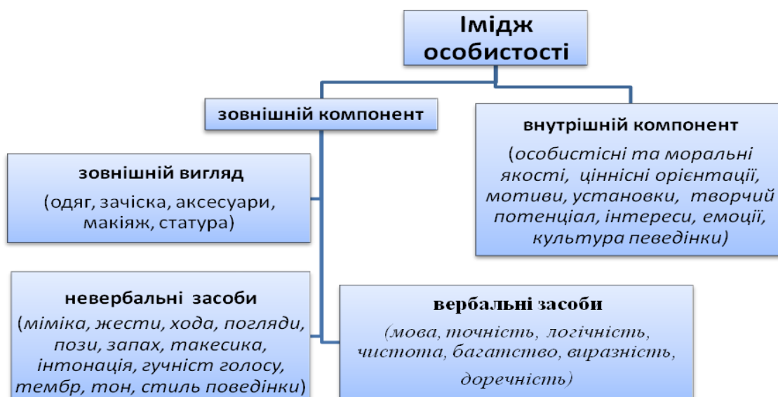
Рис. 1.1. Структурні компоненти іміджу особистості

На підставі узагальнення проаналізованого матеріалу виділяємо структурні компоненти іміджу особистості, що схематично представлені на рис. 1.1: