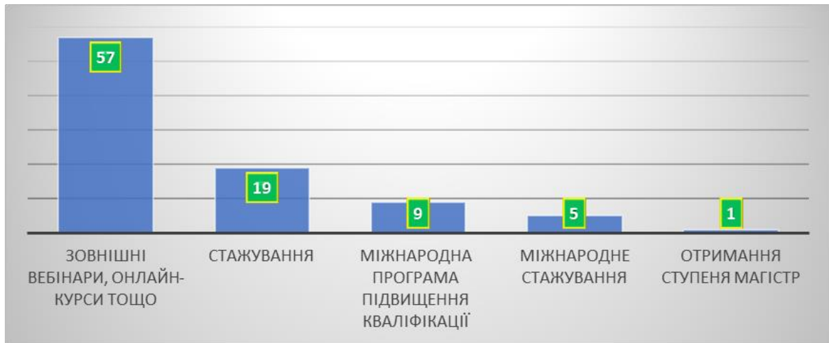
Рис. 1. Загальна кількість НПП Університету, які підвищили кваліфікацію за видами підвищення кваліфікації у 2020-2021 н.р.

Науково-педагогічні працівники кафедр Університету протягом 2021-2022 н.р. постійно підвищували кваліфікацію онлайн, з використанням ресурсів та технологій мережі Інтернет. Через мережу Інтернет (платформа «Всеосвіта», «EdEra», «Prometheus», UGEN, JTI, World TESOL Academy та ін.) викладачі кафедр брали планову та позапланову участь у науково-практичних онлайн конференціях, вебінарах, семінарах, практикумах, тренінгах де отримали/розширили загальні та професійні компетенції й підвищили професійну майстерність, а отриманий досвід використовували в навчальному процесі та науковій роботі.