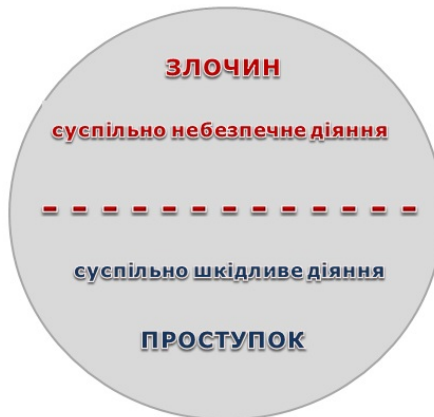
Рис. 7.1. Поділ правопорушення ( delictum ) на злочин і проступок за ознакою суспільної небезпеки

У римському праві юристи виділяли особливу групу деліктів – квазиделікти. Це ненавмисне позадоговірне правопорушення, заподіяння кому-небудь шкоди без умислу (або навіть можливості заподіяння такої шкоди), у результаті недбалості або необережності, що характеризується при цьому відсутністю визначеності винної особи. Наприклад, коли виставлений на підвіконні горщик впав (або міг впасти) і причинив шкоду особі або майну.