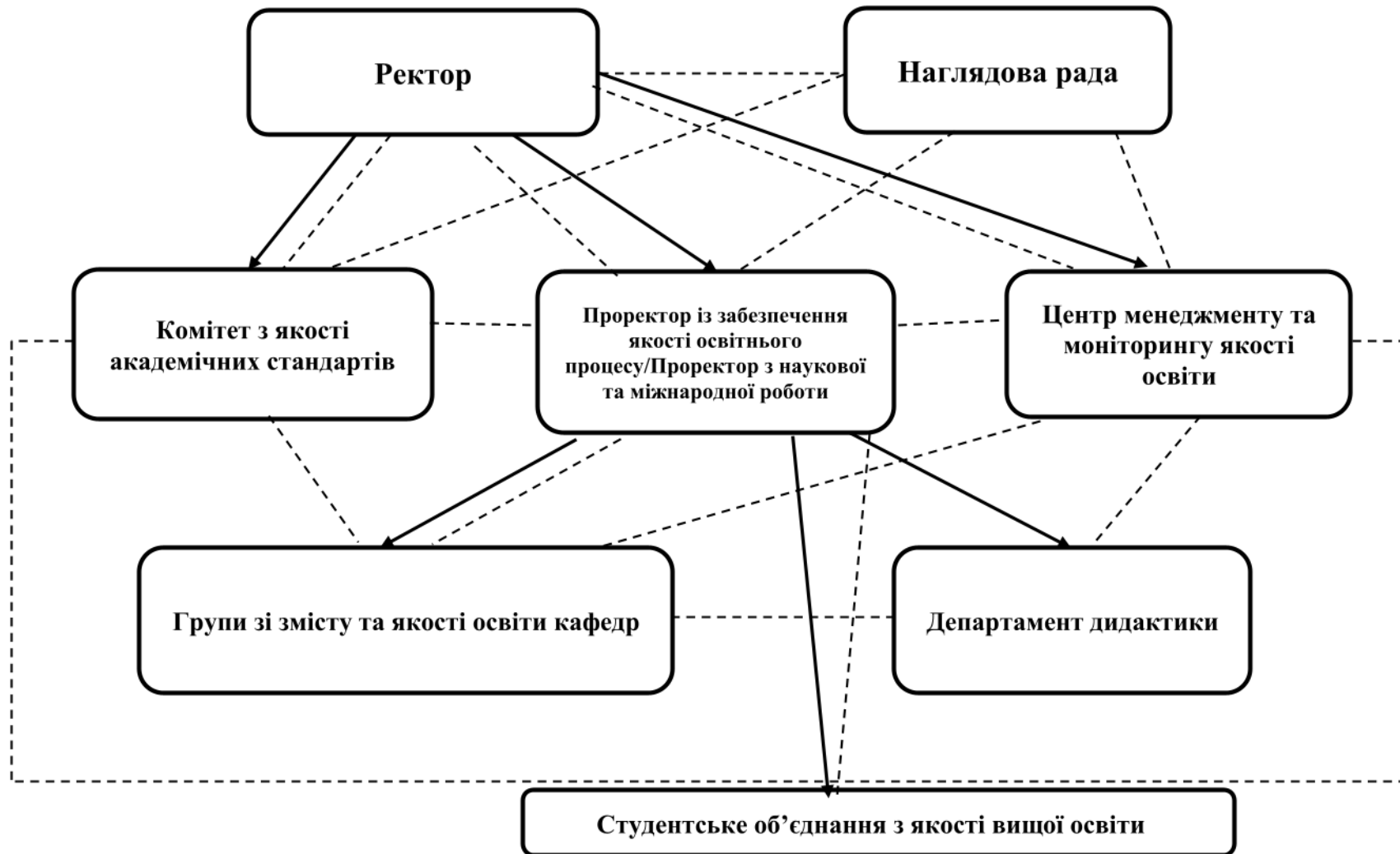
Рис 1. Організаційна структура системи внутрішнього забезпечення якості в Університеті імені Альфреда Нобеля