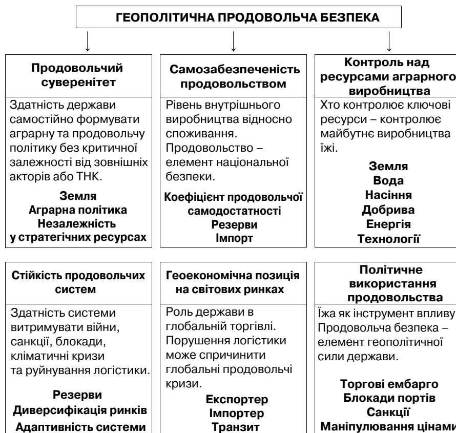
Рис. 1. Складники геополітичної продовольчої безпеки

Повномасштабне вторгнення Росії в Україну у 2022 р. спровокувало найбільше зростання глобальної продовольчої незахищеності за останнє століття. Україна, яку традиційно називають “житницею світу”, до війни забезпечувала близько 46 % світового експорту соняшникової олії, 9 % пшениці, 17 % ячменю та 12 % кукурудзи [10]. Російська стратегія з перших днів