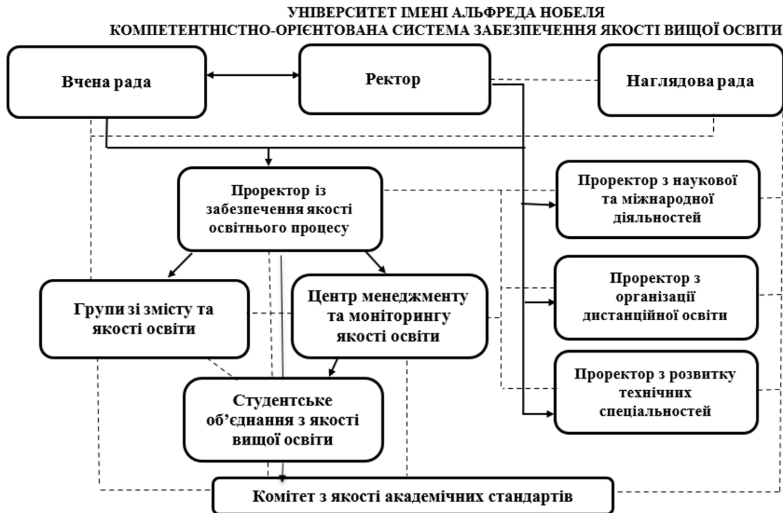
Рис 1. Організаційна структура системи внутрішнього забезпечення якості в Університеті імені Альфреда Нобеля Умовні позначення: