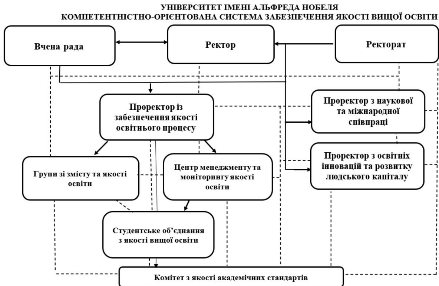
Рис 1. Організаційна структура системи внутрішнього забезпечення якості в Університеті імені Альфреда Нобеля