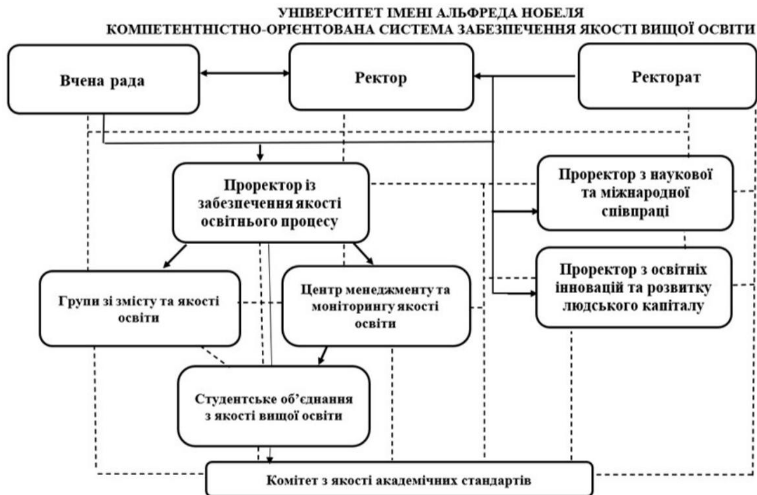
Рис 1. Організаційна структура системи внутрішнього забезпечення якості в Університеті імені Альфреда Нобеля